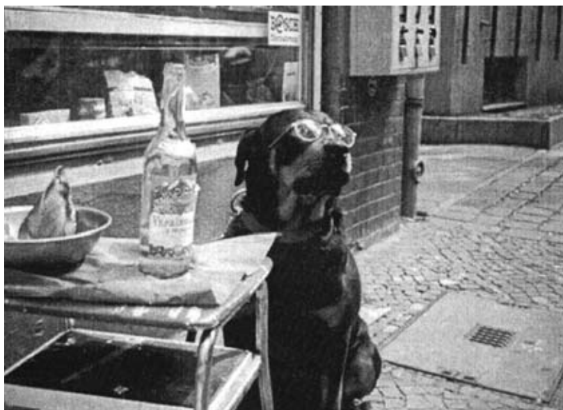
Есть здесь что выпить и закусить